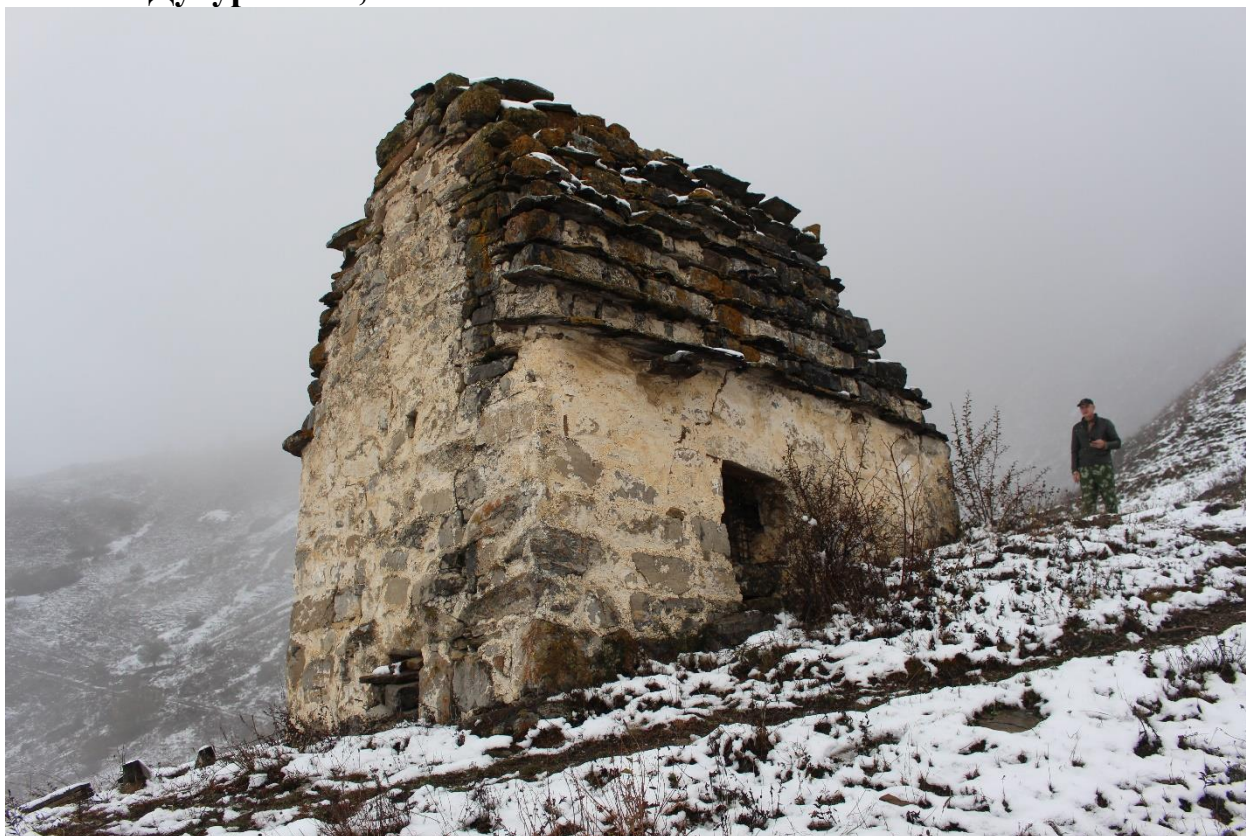
Фото 5. 26 октября 2024 г. Топоровский Е.М. Вид через руины заградительной оборонительной стены Выявленного объекта культурного наследия «Башня