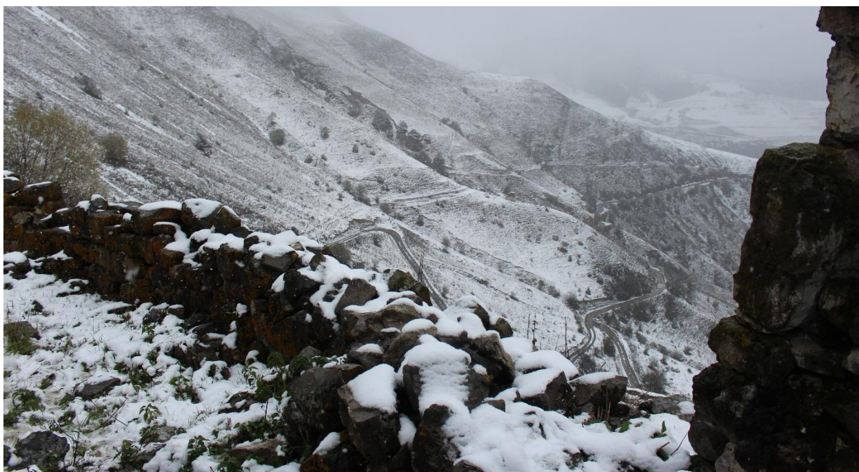
Фото 3. 26 октября 2024 г. Топоровский Е.М. Вид через руины заградительной оборонительной стены Выявленного объекта культурного наследия «Башня Бэрер-Гала» XIV-XV век на Выявленный объект культурного наследия «Наземный склеп близ селения Духургишт, XIV-XV век.

На заднем плане видна лента горной дороги-серпантин, ведущая к Башне Бэрер-Гала, XIV-XV век и родовому Наземному склепу, XIV-XV век.