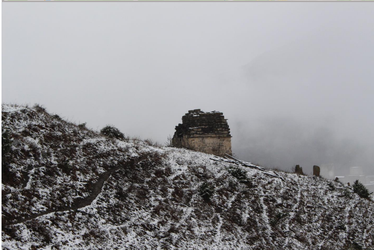
Фото 1. 26 октября 2024 г. Топоровский Е.М. Выявленный объект культурного наследия «Наземный склеп близ селения Духургишт», XIV-XV век Духургишт, входит в состав Джейрахско-Ассинского государственного историко-архитектурного и природного музея-заповедника.