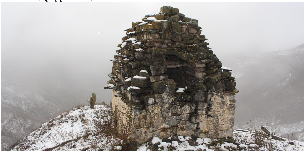
Фото 4. 26 октября 2024 г. Топоровский Е.М. Вид через руины заградительной оборонительной стены Выявленного объекта культурного наследия «Башня Бэрер-Гала» XIV-XV век на Выявленный объект культурного наследия «Наземный склеп близ селения Духургишт, XIV-XV век.