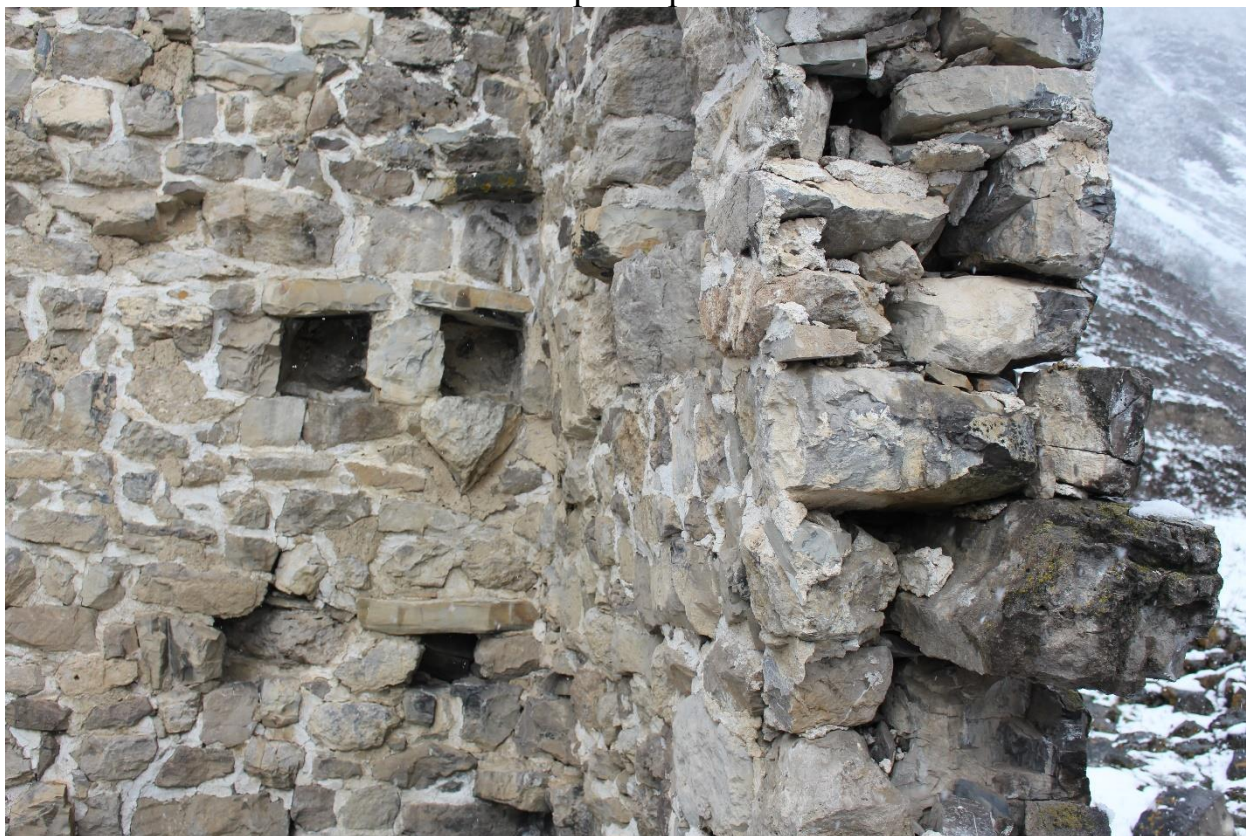
Фото 2. Фрагмент сохранившегося внутреннего пространства ОКН «Башня Бэрер-Гала», хорошо просматривается характер каменной кладки стен, толщина наружной стены и гнезда под балки междуэтажных перекрытий. 26 октября 2024 г. Топоровский Е.М.

Выявленный объект культурного наследия «Башня Бэрер-Гала» XIV-XV век Республика Ингушетия, Джейрахский район, с.п. Бейни, южный отрог горы Мятлом