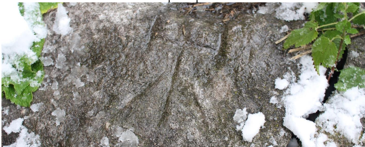
Фото 3. Фрагмент внутреннего пространства ОКН. На каменных плитах пола виден, вырезанный «Петроглиф». 26 октября 2024 г. Топоровский Е.М.

Выявленный объект культурного наследия «Башня Бэрер-Гала» XIV-XV век Республика Ингушетия, Джейрахский район, с.п. Бейни, южный отрог горы Мятлом