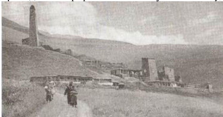
Общий вид с. Лежг. 1963 г.

Только в послеоктябрьскую эпоху, когда началось комплексное историко-культурное изучение ингушского народа, было уделено должное внимание и архитектурным памятникам края. Огромная заслуга в этом начинании принадлежит проф. Л.П. Семенову. Вместе с художником-арх. И.П. Щерблыкиным