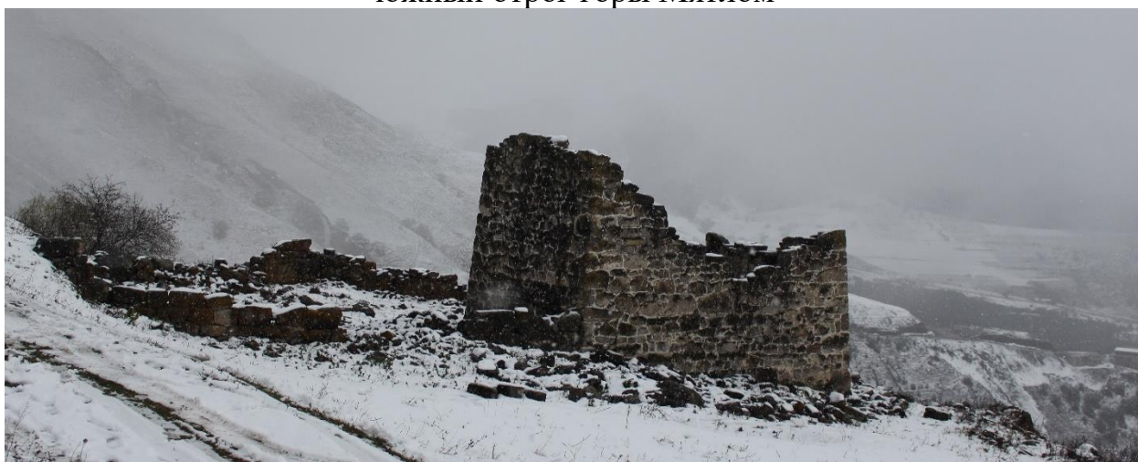
Фото 1. Памятник градостроительства и архитектуры, «неудовлетворительное техническое состояние ОКН». 26 октября 2024 г.

Выявленный объект культурного наследия «Башня Бэрер-Гала» XIV-XV век Выявленный объект культурного наследия «Башня Бэрер-Гала» XIV-XV век Республика Ингушетия, Джейрахский район, с.п. Бейни, южный отрог горы Мятлом